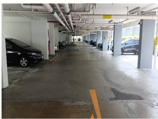
รูปที่ 1-1 สภาพภายในพื้นที่โครงการ